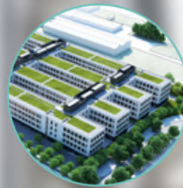
BMW Freimann München

Wir planen, konstruieren und liefern die Technik für Großprojekte in Österreich und Deutschland, wie zum Beispiel Bildungseinrichtungen, Flughäfen, Pharmaindustrie, Einkaufszentren, Wohnkomplexe, Hotels und Bürogebäude oder Krankenhäuser.