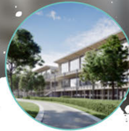
Trambrennbahn Kriemau Wien